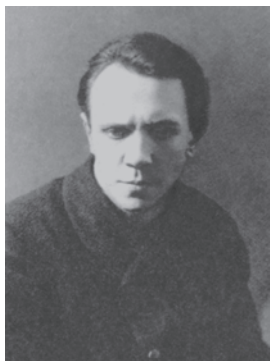
М. А. Чехов

Ее книгу «Освобождение голоса» я перевела в 1993 году на русский язык, внося в нее изменения с учетом особенностей звуков русской речи.