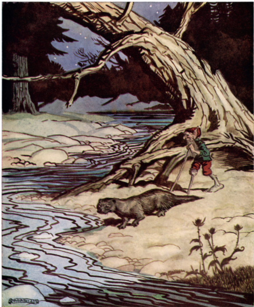
Вьюнок и Водокрыс у обмелевшего ручья.