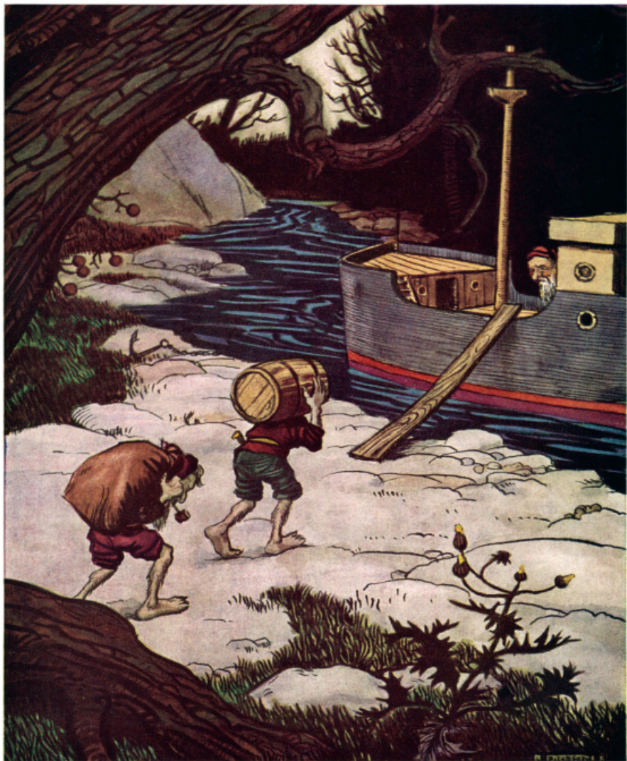
Гномы переносят припасы на борт «Джини Динс».