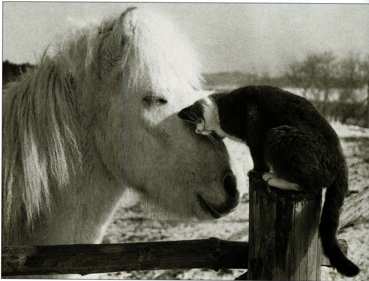
ПЕР УИЧМАНН В деревне (из серии) Швеция, 1989